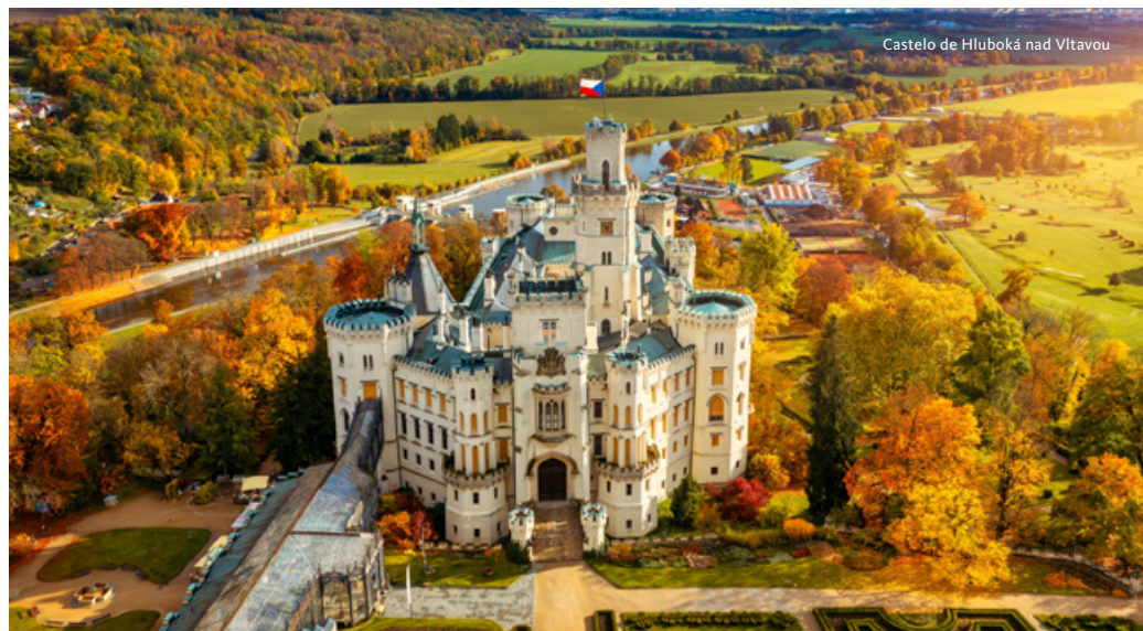
Castelo de Hluboká nad Vltavou

Partida para Slavkov u Brna, local onde ocorreu a famosa batalha dos Três Imperadores, que resultou na vitória de Napoleão Bonaparte contra o exército russo e austríaco. Visita ao Castelo de Slavkov, um palácio de estilo barroco que impressiona a todos com a sua grandeza e relevância histórica. No seu interior poderemos encontrar uma vasta coleção de esculturas, pinturas e exposições que remontam ao século XVI, proporcionando uma imersão na história da região. Continuação para Kromeríž. Visita ao Castelo e seus sumptuosos jardins, classificados como Património da Humanidade pela UNESCO. Construído no século XVI, o Castelo foi usado como cenário do famoso filme de drama biográfico "Amadeus", de 1984. Já no exterior podemos encontrar alguns dos melhores exemplos de arte paisagística da Europa, servindo como fonte de inspiração de inúmeros artistas ao longo do tempo. Regresso a Brno. Jantar. Alojamento.