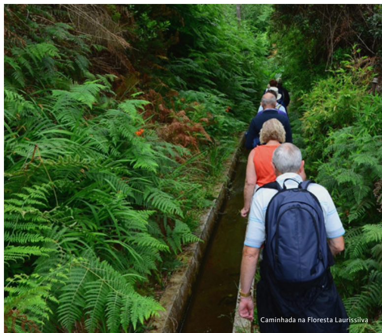
Caminhada na Floresta Laurissilva

e o Barbuzano (percurso moderado e plano com possibilidade de efetuar só parte do trajeto a pé e retomar os jipes, que estarão ao nosso dispor durante o percurso). Regresso ao hotel. Jantar e alojamento.