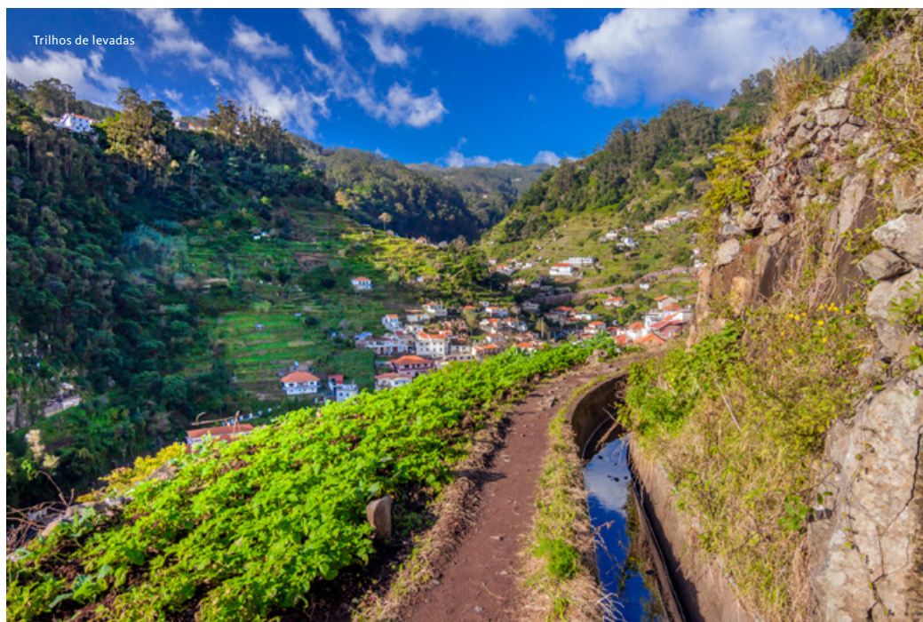
Trilhos de levadas

variados. Segue-se uma visita panorâmica da Cidade do Funchal, com passagem pelo miradouro do Pico dos Barcelos em direção à Eira do Serrado para vislumbrar o vale do Curral das Freiras com vistas vertiginosas a mais de 500 metros de altura, de um dos miradouros mais impressionantes da ilha. Descida ao centro do Curral das Freiras para visita e degustação de um menu típico para o almoço . Regresso ao Funchal com transfer ao aeroporto para embarque em voo com destino ao Porto e Lisboa. Fim da viagem.