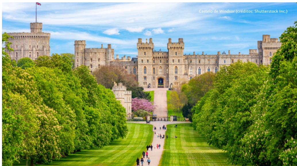
Castelo de Windsor

Início das visitas em Cambridge, cidade que alberga a segunda universidade mais antiga de Inglaterra, fundada em 1209. A Universidade de Cambridge é composta por 31 faculdades, entre as quais se destacam o King's College, o Trinity College e o St. John's College, cada uma com a sua própria história e estilo arquitetónico. Passeio pelos The Backs, uma área pitoresca