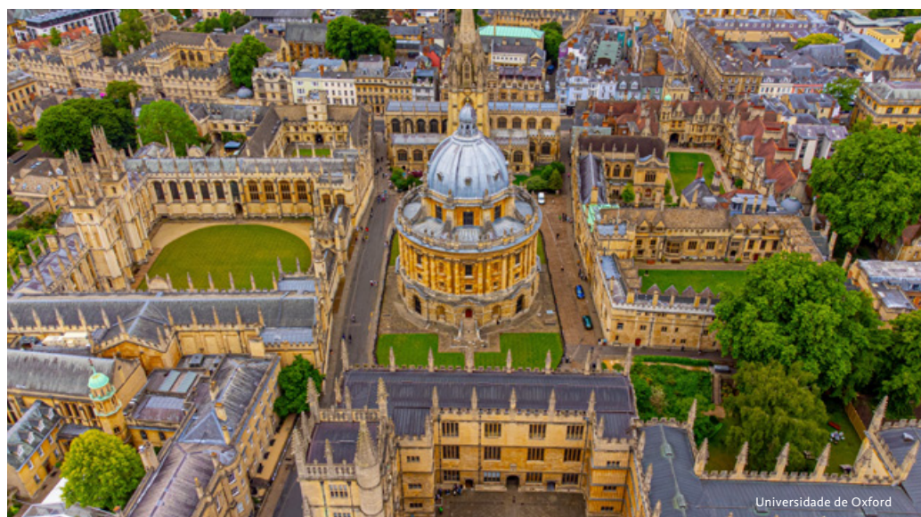
Universidade de Oxford