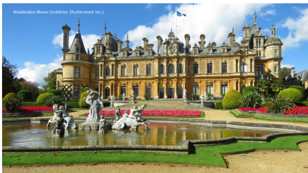
Waddesdon Manor

de jardins e relvados, ao longo do rio Cam, com vistas deslumbrantes das traseiras de algumas das faculdades, onde se destacam a Ponte dos Suspiros e a Ponte Matemática. Este é também um local popular para a prática de “punting”, uma atividade tradicional, que