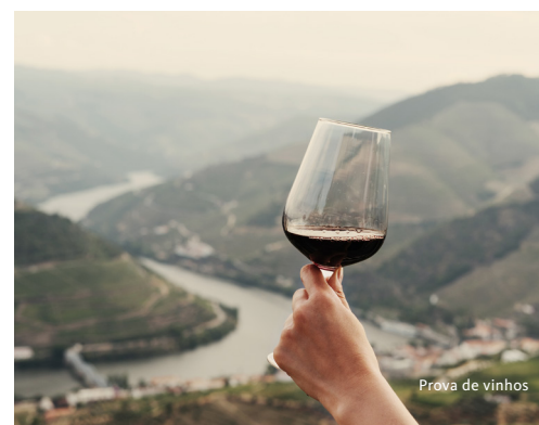
Prova de vinhos