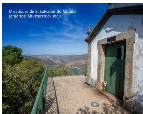
Miradouro de S. Salvador do Mundo