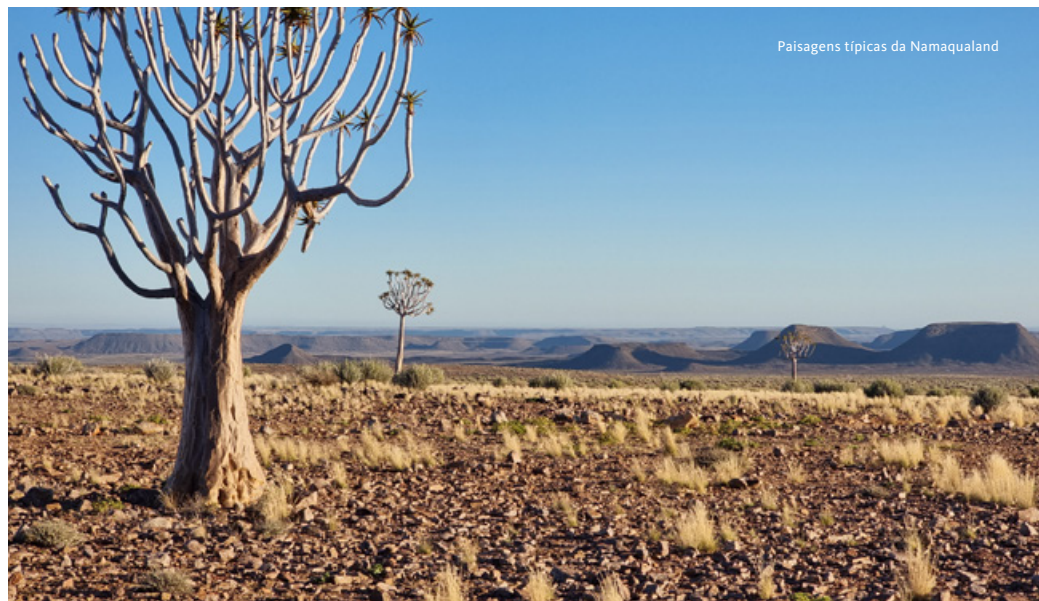
Paisagens típicas da Namaqualand

Chegada a Lisboa. Continuação em transfer privativo para o Porto. Fim da viagem.