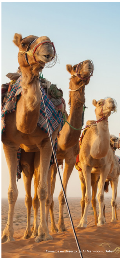
Camelos no deserto de Al Marmoom, Dubai