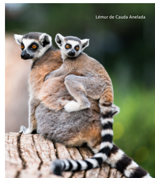
Lémur de Cauda Anelada