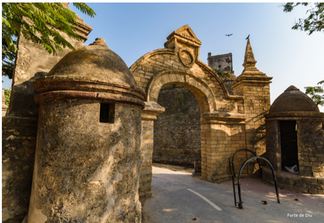
Forte de Diu