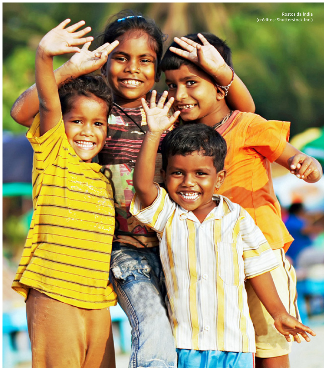
Rostos da Índia

Saída em tuk tuk para visita à zona piscatória de Vanakbara, com o seu porto e barcos coloridos. Continuação para o centro histórico, visita à igreja da Nossa Senhora da Misericórdia, com uma bonita fachada que abriga no seu interior uma estátua da Virgem Maria esculpida em madeira. Visita à Igreja de São Paulo, dedicada à Senhora da Imaculada Conceição. A sua construção iniciou-se em 1601 e foi completada no ano de 1610. Visita ao Forte de Diu, uma grandiosa estrutura situada na costa da ilha, e à Igreja de São Tomás, convertida em museu. Continuação das visitas à Igreja de São Francisco de Assis, construída pelos portugueses em 1593, convento franciscano e atualmente usada como um hospital no seu claustro. Destaque ainda para Fortim do Mar, também conhecido como a Fortaleza de Panikotha. Almoço entre visitas. Transfer ao aeroporto para embarque em voo com destino