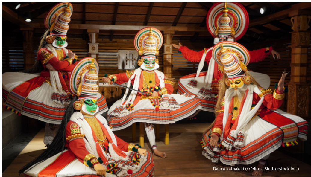
Dança Kathakali

Salvaguardam-se as situações cobertas ao abrigo da nossa apólice de seguro de viagem no capítulo Cancelamento Antecipado.