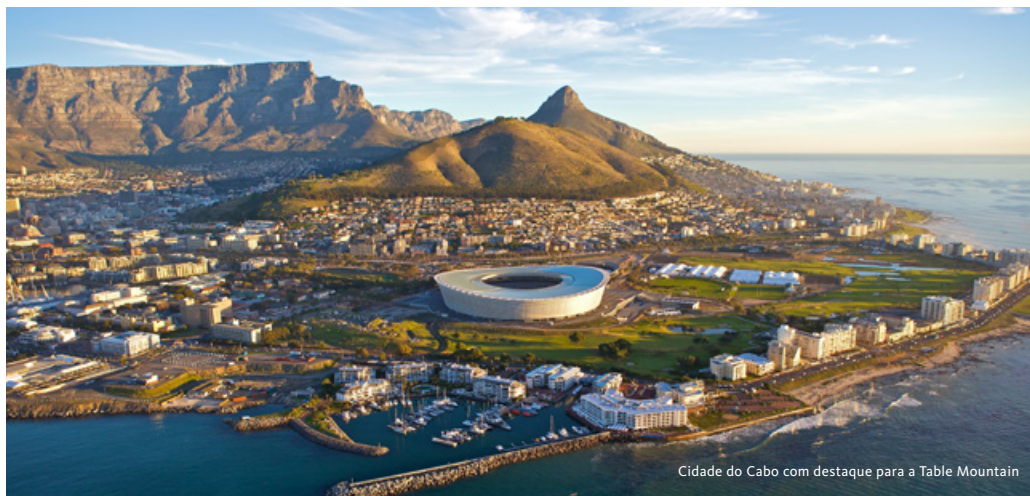
Cidade do Cabo com destaque para a Table Mountain

Dia dedicado às visitas à Cidade Península do Cabo e aos seus principais pontos de interesse. Viagem pela Ocean View Drive, com belas vistas sobre a cidade e o porto, em direção à Table Mountain. Subida em teleférico e tempo livre para apreciar a vista sobre a Península do Cabo. Continuação das visitas com destaque para a Grand Parade, praça onde os Sul-africanos se juntaram para ouvir Nelson Mandela depois de ter sido libertado, em 1990; a Câmara, imponente edifício em estilo barroco e o monumento a Bartolomeu Dias. Continuação através de Adderley Street, passando pela Catedral de São Jorge; Diocese Anglicana de Desmond Tutu; Long Street, com os seus edifícios vitorianos e varandas em ferro forjado; Company Gardens com os seus belos