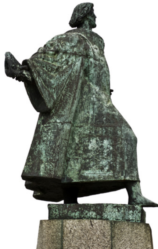
Estátua de Bartolomeu Dias na Cidade do Cabo

Salvaguardam-se as situações cobertas ao abrigo da nossa apólice de seguro de viagem no capítulo Cancelamento Antecipado.