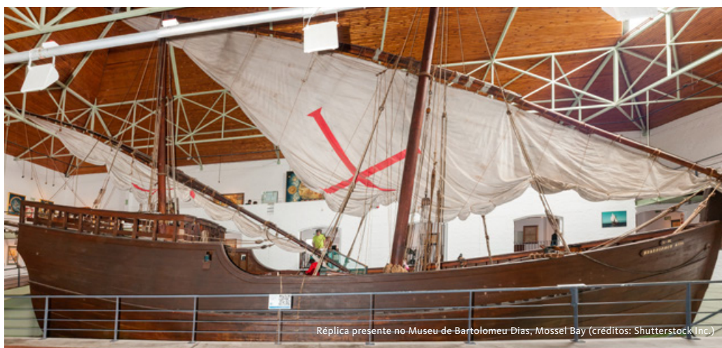
Réplica presente no Museu de Bartolomeu Dias, Mossel Bay

jardins repletos de estátuas histórica e pelo Bairro Malaio, uma área multicultural de casas coloridas na encosta de Signal Hill. Alojamento.