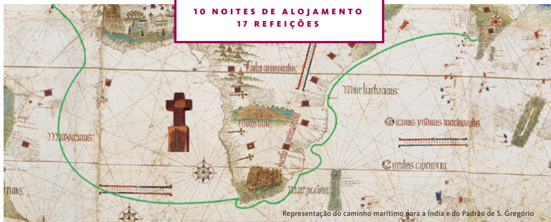
Representação do caminho marítimo para a Índia e do Padrão de S. Gregório