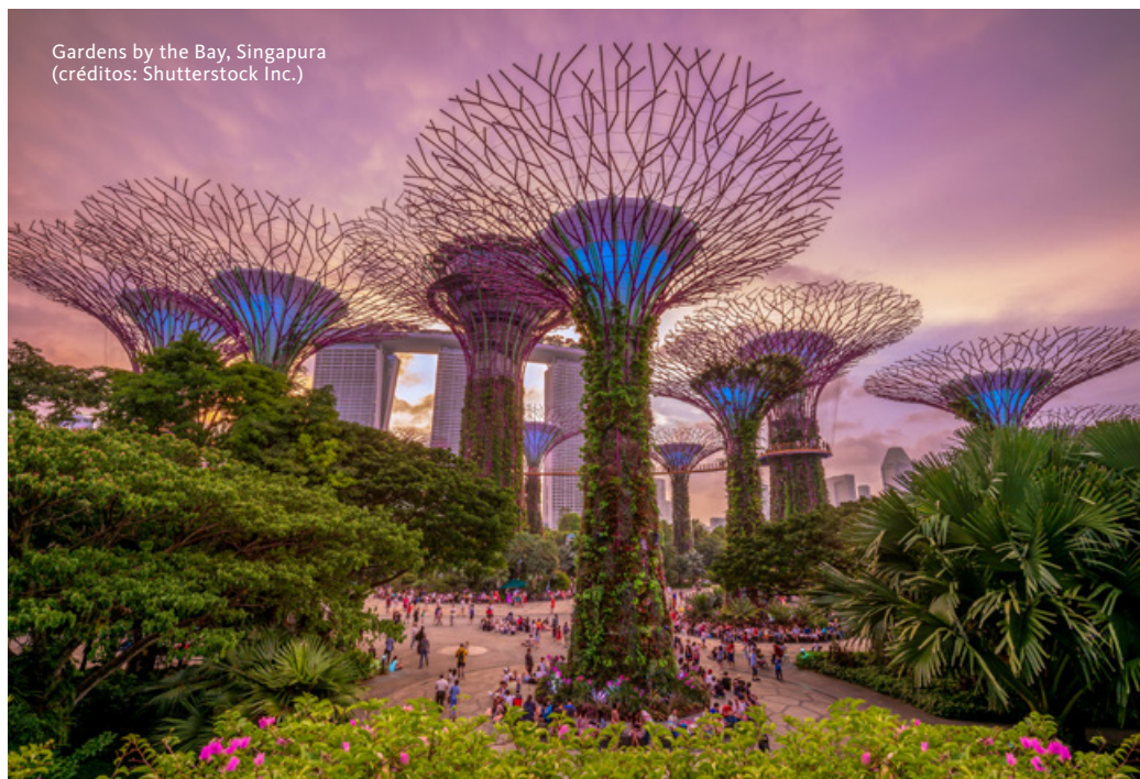
Gardens by the Bay, Singapura