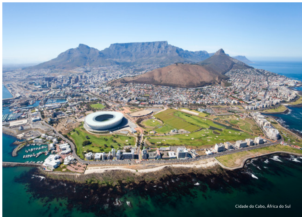
Cidade do Cabo, África do Sul

Saída muito cedo pela manhã em direção ao Lesoto, num dia preenchido pelas paisagens e vistas de cortar a respiração das Montanhas Drakensberg, onde se pode avistar uma diversa fauna e flora. Travessia da fronteira