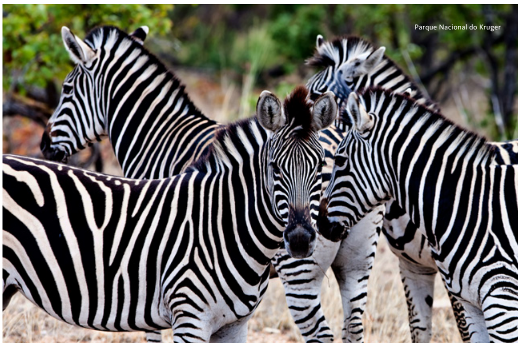
Parque Nacional do Kruger

Saída do Parque Nacional Kruger em direção a Pretória, seguindo pela Rota Panorâmica. Paragem no Desfiladeiro do Rio Blyde, o maior desfiladeiro verde do mundo, situado na Reserva Natural do Desfiladeiro do Rio Blyde. Tempo para admirar a vista para os Três Rondavels, três montanhas que ganharam esta