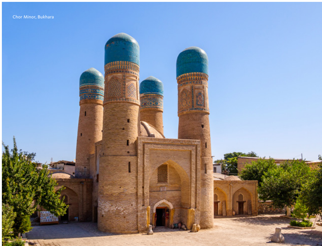
Chor Minor, Bukhara