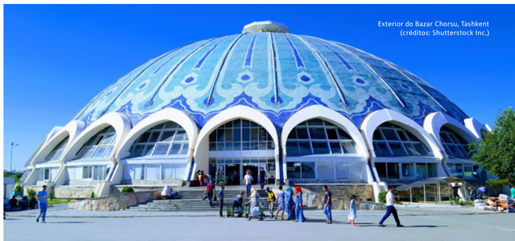
Exterior do Bazar Chorsu, Tashkent

Salvaguardam-se as situações cobertas ao abrigo da nossa apólice de seguro de viagem no capítulo Cancelamento Antecipado.