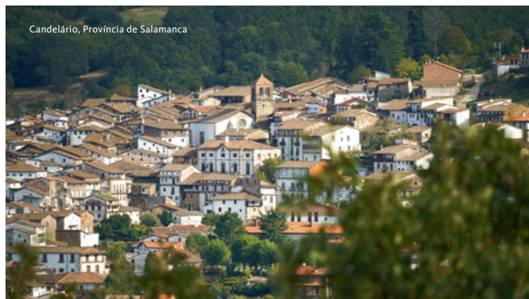
Candelário, Província de Salamanca