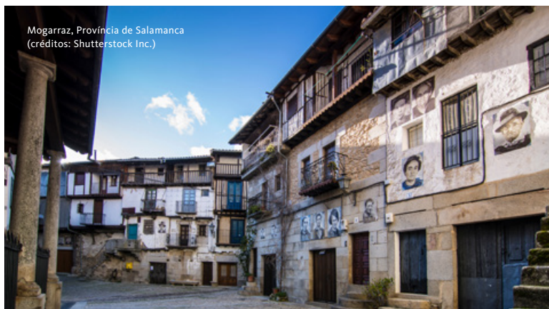
Mogarráz, Província de Salamanca