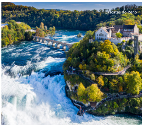
Cascatas do Reno