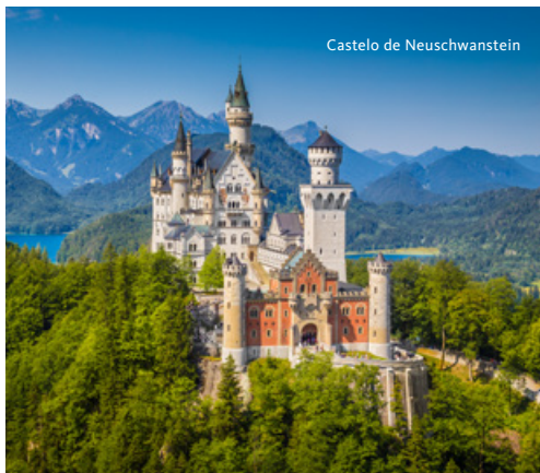
Castelo de Neuschwanstein