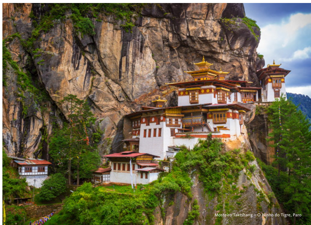
Mosteiro Taktshang – O Ninho do Tigre, Paro

Saída para Changu Narayan. Visita ao Templo construído no século IV e classificado Património da Humanidade pela UNESCO. Este templo é dedicado ao Lord Vishnu na sua encarnação como Narayan, o ídolo com 10 cabeças e 10 braços. Possui um telhado duplo com leões em pedra a guardar as portas. Partida para a cidade de Bhaktapur (Património da Humanidade pela UNESCO), em pleno Vale de Kathmandu. Almoço. Visita à cidade, também conhecida como a Cidade da Cultura, e famosa pela arte e cultura tradicionais. Por muitos considerada um museu a céu aberto, reúne belíssimas e inúmeras obras-primas de carácter monumental. Destaque para a praça principal da cidade, praça Durbar e para o palácio das 55 janelas mandado construir pelo rei Bhupatindra Malla e residência da realeza até 1769. Visita ao Templo Taleju, dedicado à deusa Taleju Bhawani. Este santuário, como outros no Vale de Kathmandu, é um local sagrado que inclui templos dedicados à deusa Taleju Bhawani e