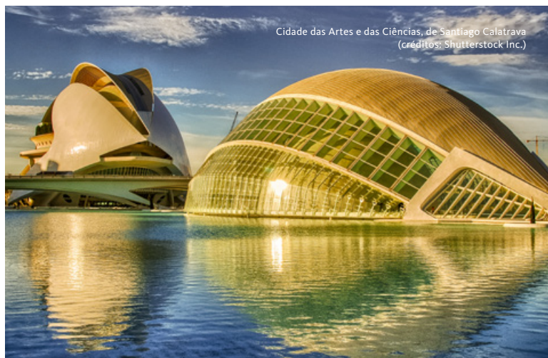
Cidade das Artes e das Ciências, de Santiago Calatrava