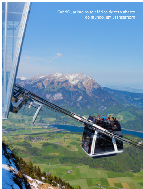
Cabrio, primeiro teleférico de teto aberto do mundo, em Stanserhorn