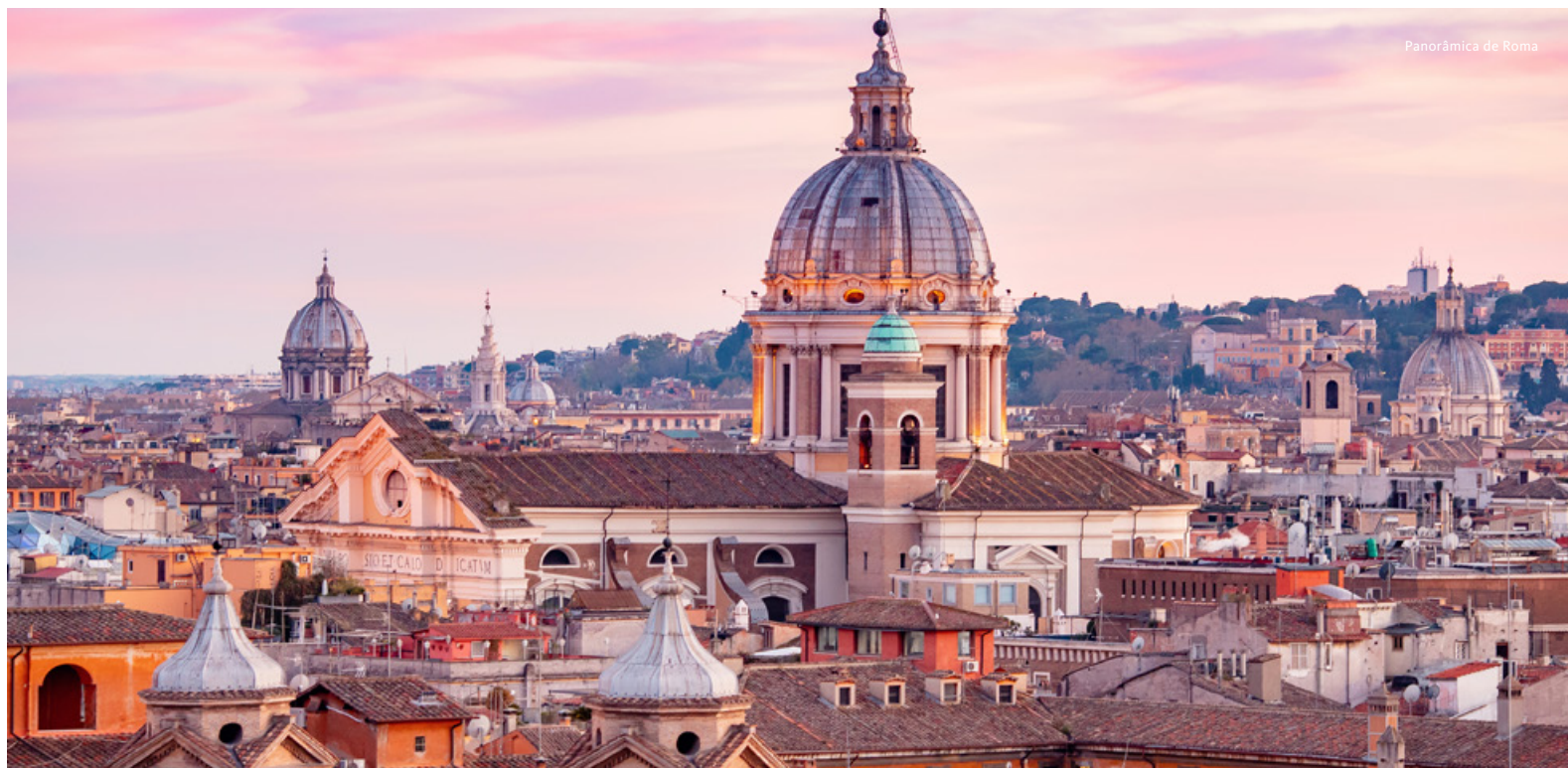
Panorâmica de Roma