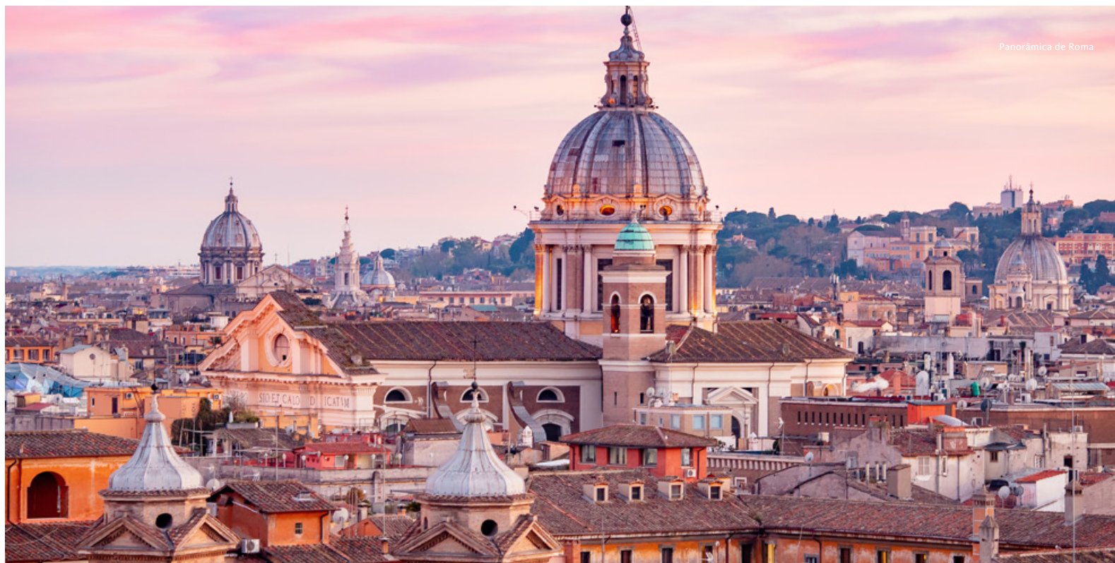
Panorâmica de Roma