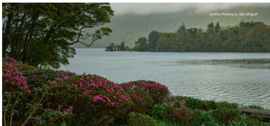
Jardim Pitoresco, São Miguel

Partida para Capelas para visita à Quinta da Torre, antiga quinta de produção de laranja e outras frutas, que manteve até hoje a sua compartimentação em sebes vivas e que atualmente produz em modo biológico. Do mirante avistam-se amplos panoramas sobre a costa norte da ilha. Partida para as Sete Cidades para visita ao Jardim Pitoresco. Depois de passada a ponte que separa a Lagoa Verde da Lagoa Azul ergue-se a antiga casa de veraneio de António Borges da Câmara Medeiros (1812-1879), grande proprietário e colecionador de pintura que se serviu do cenário natural da Lagoa para pano de fundo da transformação paisagística que logrou impor sobre uma parte da cratera das Sete Cidades. Ocupando a margem sudoeste da Lagoa Azul das Sete Cidades, no extremo ocidental da ilha, o Jardim Pitoresco manteve-se na posse dos seus herdeiros constituindo a parcela remanescente de um antigo e extenso arboreto. Destaque para a longa alameda de camélias marginando a lagoa onde merecem destaque diversas antigas cultivares italianas. Almoço. Em horário a combinar, transfer ao aeroporto para embarque em voo com destino ao Porto ou Lisboa. Fim da viagem.