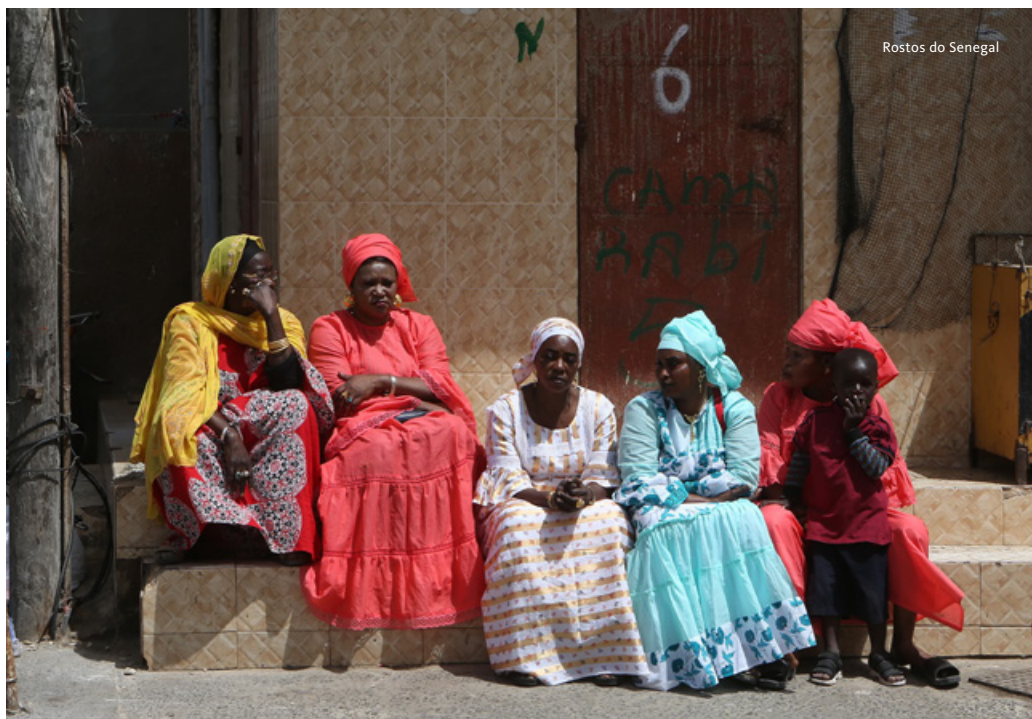
Rostos do Senegal

Saída em direção à Abadia de Keur Moussa, um mosteiro beneditino no percurso para o lago Retba, também apelidado de Cor-de-Rosa. Aninhado entre dunas de areia branca e o Oceano Atlântico, ficou conhecido devido à sua cor peculiar, originada por uma microalga salina, dunaliella salina, uma alga viva que aqui habitava e era atraída pelo sal. Atualmente, a microalga desapareceu, assim como a cor rosa do lago, mas fica a paisagem peculiar neste local onde terminava o Rally Paris-Dakar. A seguir ao Mar Morto, este lago apresenta os mais elevados níveis de sal, cerca de 40%, sendo que a sua coleta tem servido de rendimento a muitos locais. Almoço. Continuação para St. Louis, a primeira capital do Senegal, herança colonial francesa e hoje Património Cultural da Humanidade pela UNESCO. Jantar. Alojamento no Hotel La Residence ou similar.