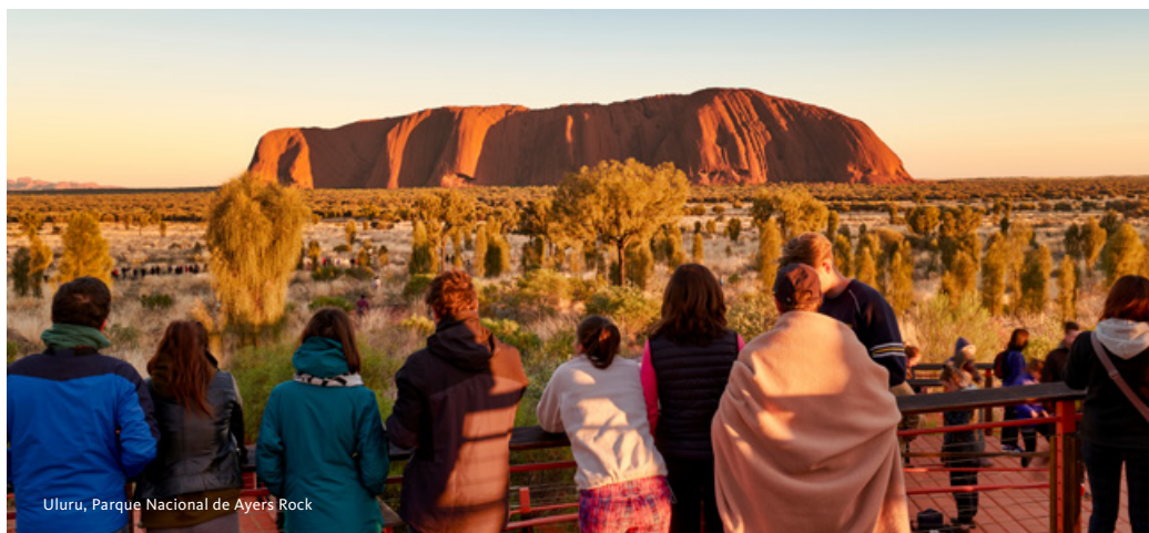
Uluru, Parque Nacional de Ayers Rock

entre visitas. Regresso num dos teleféricos mais emblemáticos da Austrália, com cerca de 7,5 kms de extensão, sobre a floresta tropical e com vistas esplêndidas do mar. Continuação em autocarro até ao centro da cidade. Alojamento.